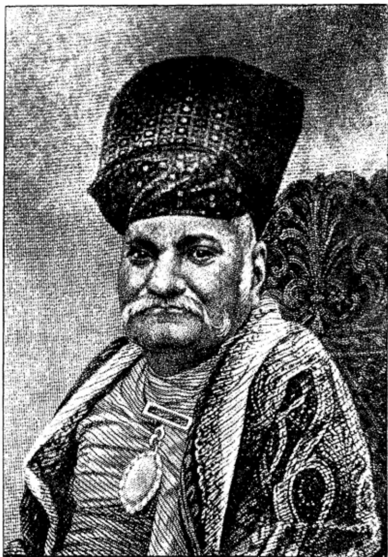
SIR JAMSETJEE JEJEEBHOY, (First Baronet).

In whose honour The Sir Jamsetjee Jejeebhoy Translation Fund was established.