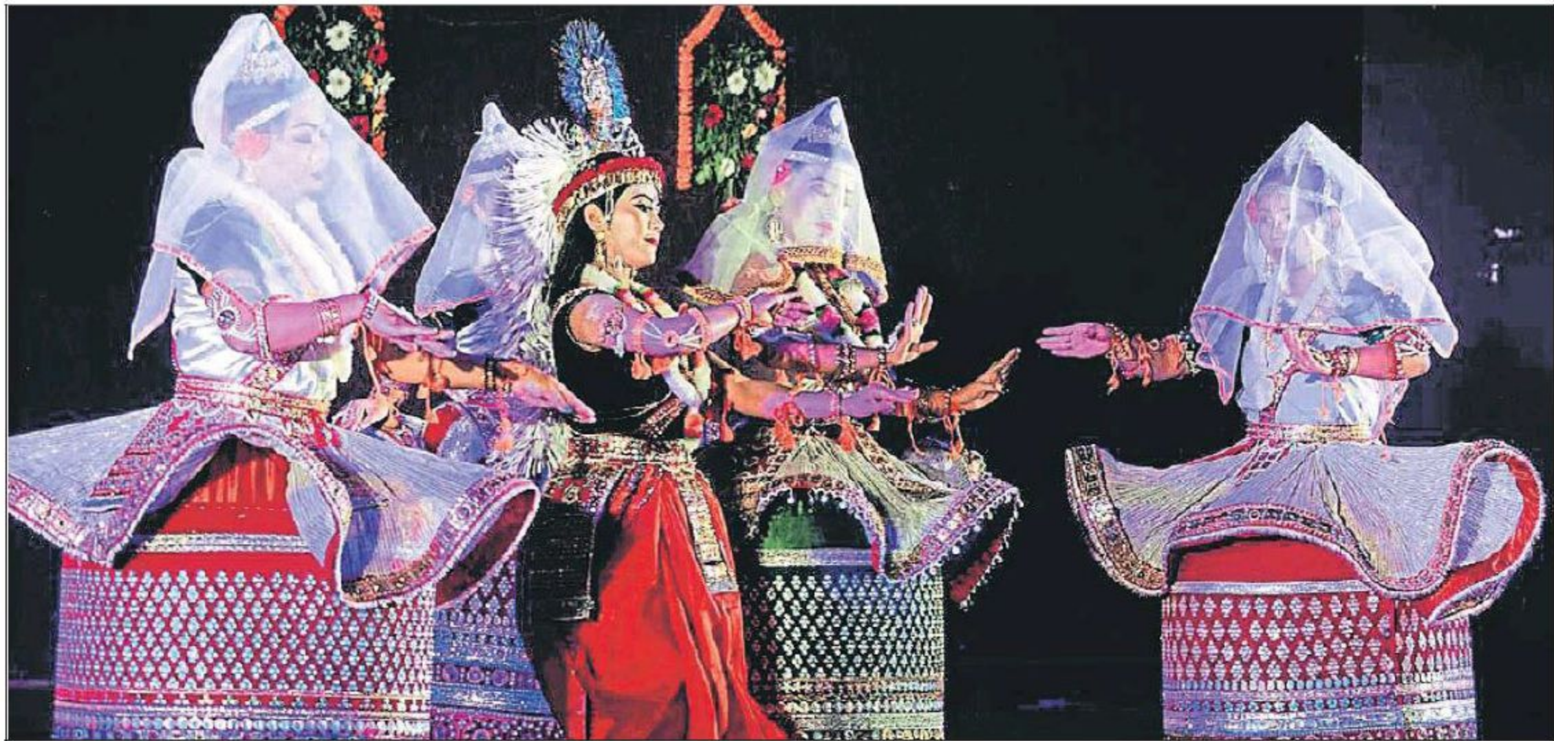
■ Classical dancers from Manipur perform 'Rashlila' during a programme organised by the Indira Gandhi National Centre for Arts at Ranchi university on Friday.