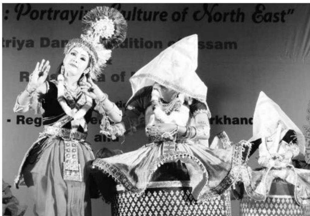
Vasant Raas, the Manipuri Raas Leela being staged at Aryabhata Stadium on Friday during Outreach- Portraying the Culture of North East programme