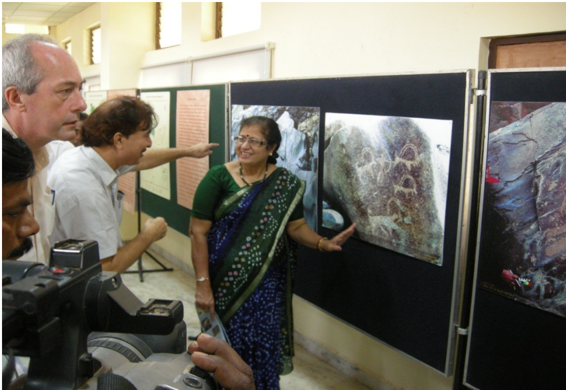
Figure 4: Dignitaries visit to Exhibition