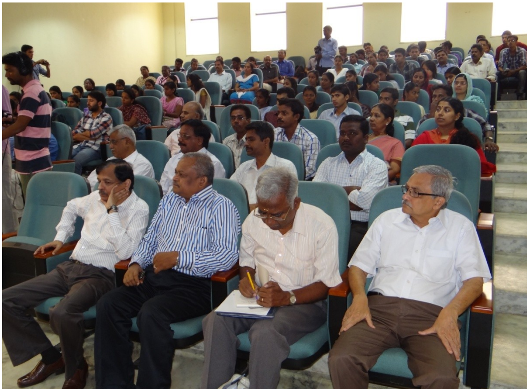
Figure 2: General Gathering during the Special Lecture