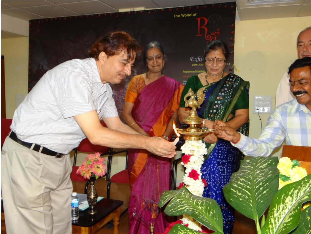
Figure 1: Chief Guest at Inauguration ceremony