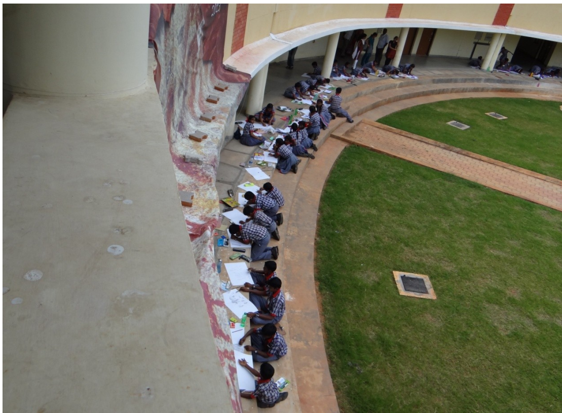
Figure 3: Children's Workshop