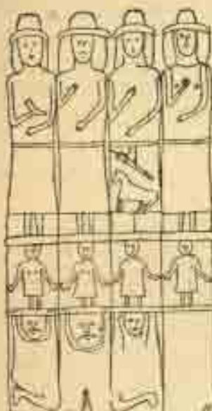
Idole de Bierzynie.

La main gauche repose à peu près à la hauteur du nombril. Sur deux des faces les mains ne tiennent rien. Sur une d'entre elles la main droite tient une sorte d'anneau, sur une autre une corne à boire (la corne dont il est évidemment question dans Saxo Grammaticus ). Sur trois faces on aperçoit des pieds apparents; ils reposent sur un bas-relief représentant une femme (ou un enfant), sorte de cariatide soutenue elle-même par un personnage agenouillé. Sur l'une des faces figurent un sabre (ou un carquois) et un cheval. Ainsi un certain nombre de détails concordent