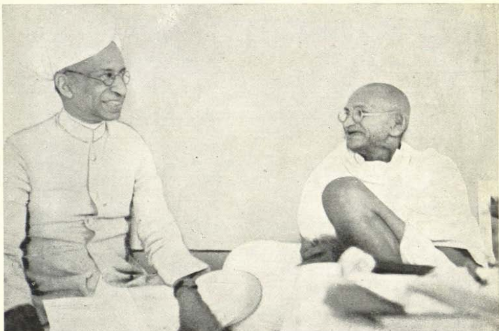
सर स. राधाकृष्णन् और गांधीजी