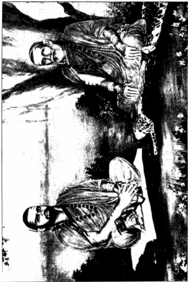
3. (Right) SRI JAGADGURU SRI ABHINAVA VIDYATIRTHA MAHASANNIDHANAM (Left) SRI JAGADGURU SRI BHARATI TIRTHA SANNIDHANAM