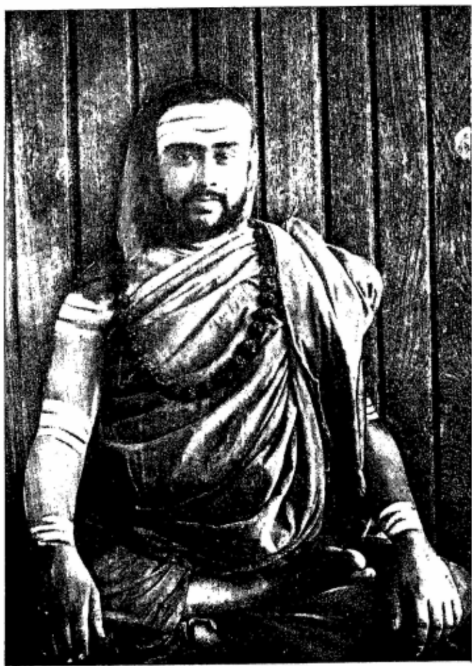
2. SRI CHANDRASEKHARA BHARATI