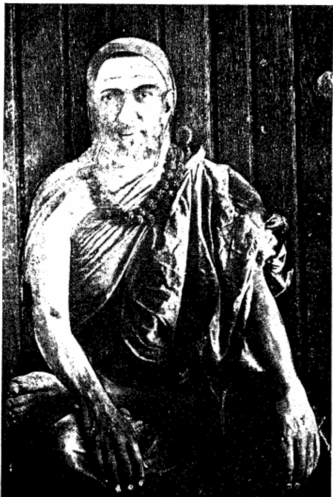
1. SRI SACCHIDANANDA SIVABHINAVA NRSIMHA BHARATI