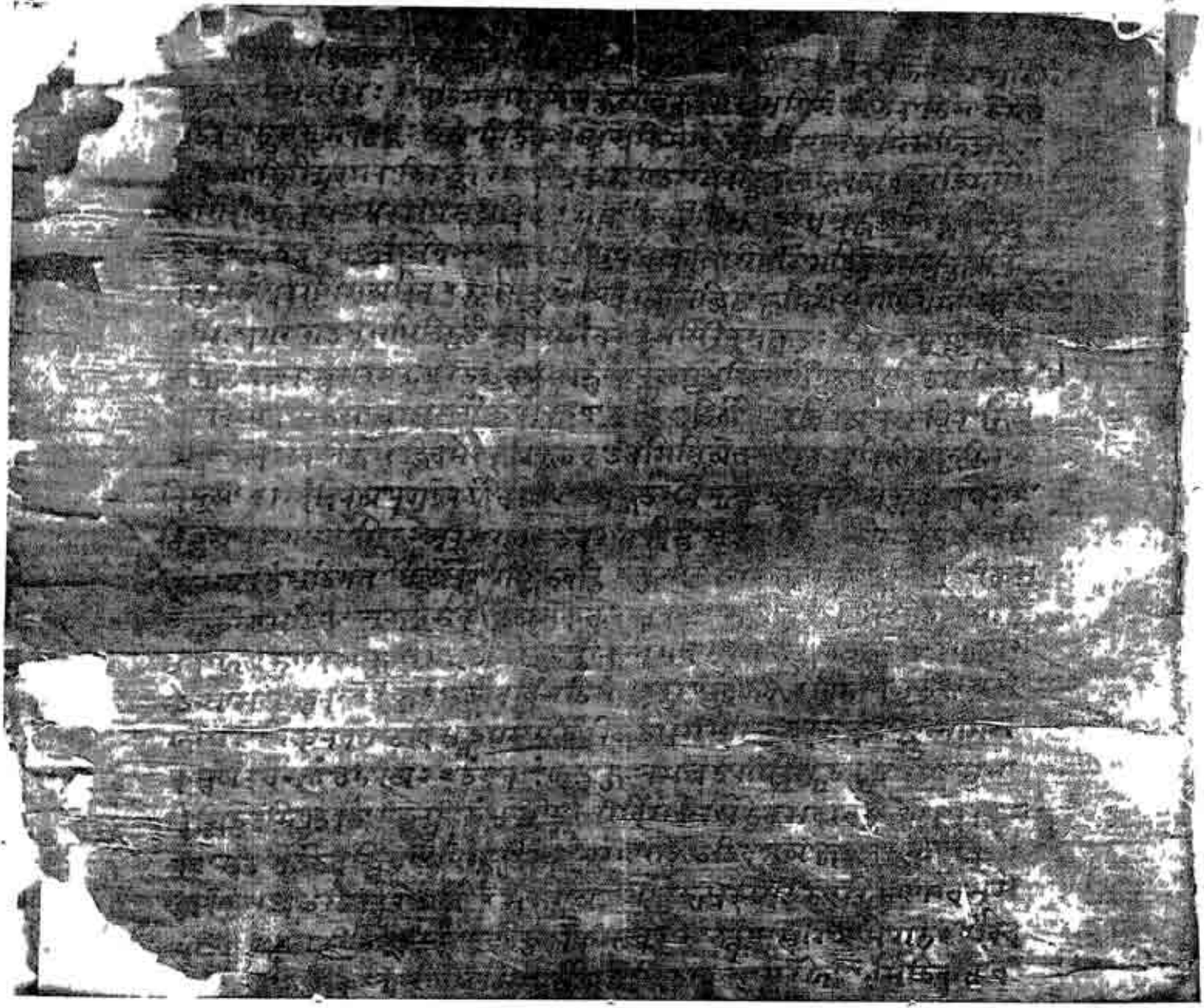
FACSIMILE OF FOLIO 65 (b) OF THE ORIGINAL KASHMIRI MANUSCRIPT (PAGE 231, v. 62 TO PAGE 233, v. 69 OF THIS EDITION).