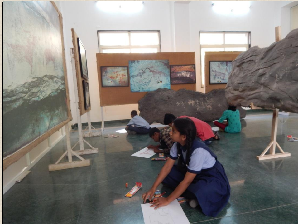
Students participating the Workshop