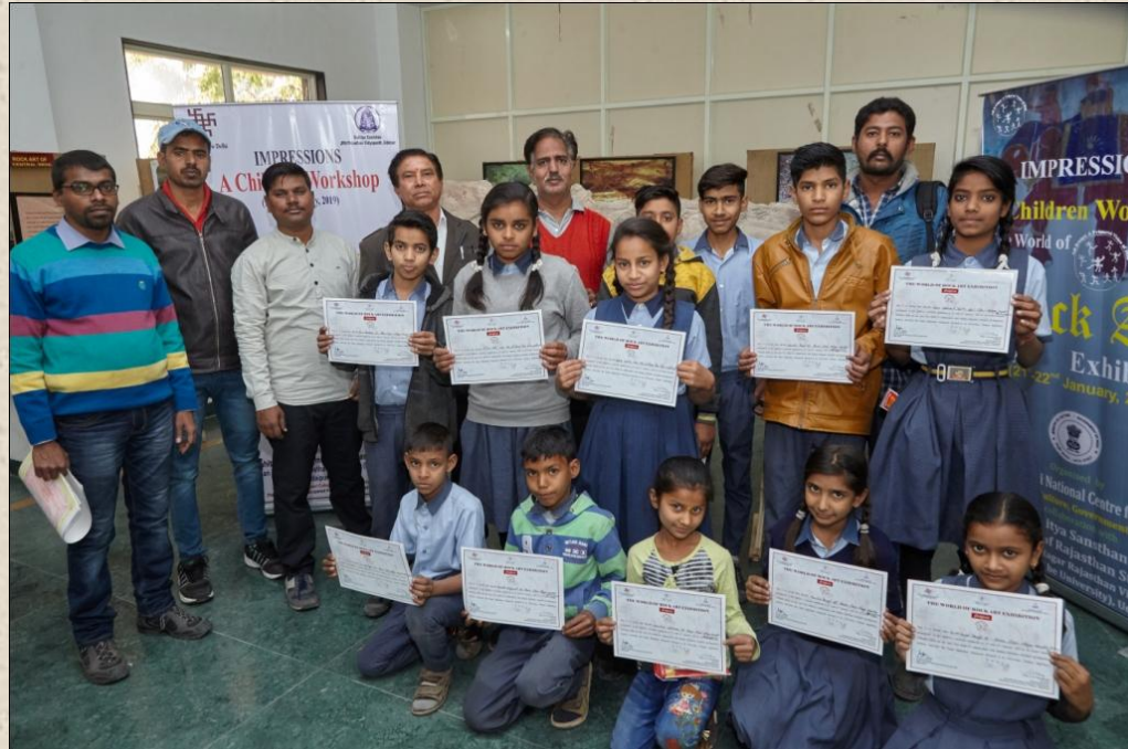
Children's with workshop certificates