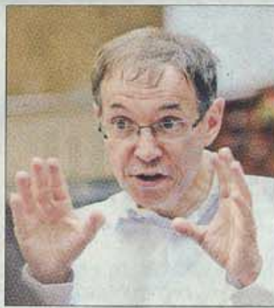
克里斯蒂安·麦斯特