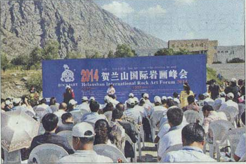
2014贺兰山国际岩画峰会在贺兰山岩画景区举行。

财产,他利用此次贺兰山国际岩画峰会的平台,了解到了宁夏、乃至世界的岩画,机会非常难得。“中印岩画联展”