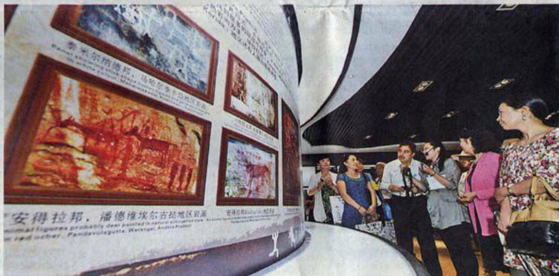
People visiting the Indian Rock Art Exhibition.