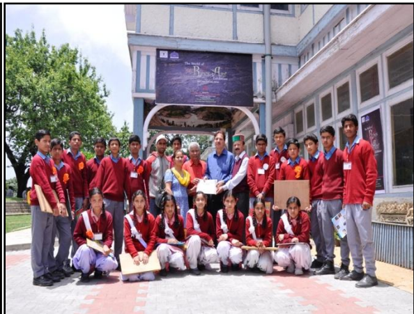
School children participating in the children's workshop on Rock Art.