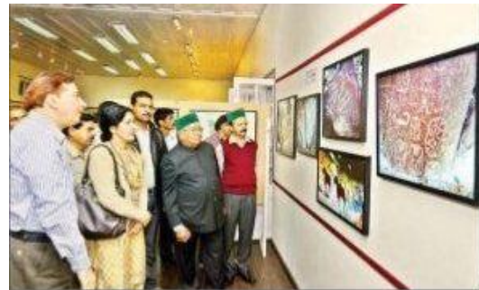
शिमला : राज्य संग्रहालय में आयोजित रॉक आर्ट प्रदर्शनी का अवलोकन करते विधानसभा अध्यक्ष बी.बी.एल. बुटेल

शिमला शहर के स्कूल के बच्चे भी प्रदर्शनी को देखने के लिए संग्रहालय पहुंचे और कार्यशाला में भाग लिया। यह प्रदर्शनी 24 जून तक आयोजित होगी और बच्चों के लिए गुरुवार को भी कार्यशाला का आयोजन किया जाएगा।