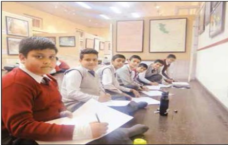
राज्य संग्रहालय में चित्रकला प्रतियोगिता में भाग लेते स्कूली बच्चे।

लोगों को वर्ल्ड रॉक आर्ट के बारे में बताना है। प्राचीन भारत की क्षेत्रीय जनजातियों जिनमें राठवा समुदाय गुजरात, वरली महाराष्ट्र, सौरा उड़ीसा को दर्शाया गया है। इसके अलावा इसमें पांच महाद्वीपों के रॉक आर्ट्स को भी बताया गया है। इसमें चीन, पाकिस्तान, जापान, आस्ट्रेलिया, अमेरिका के देशों के रॉक आर्ट को भी दर्शाया है।