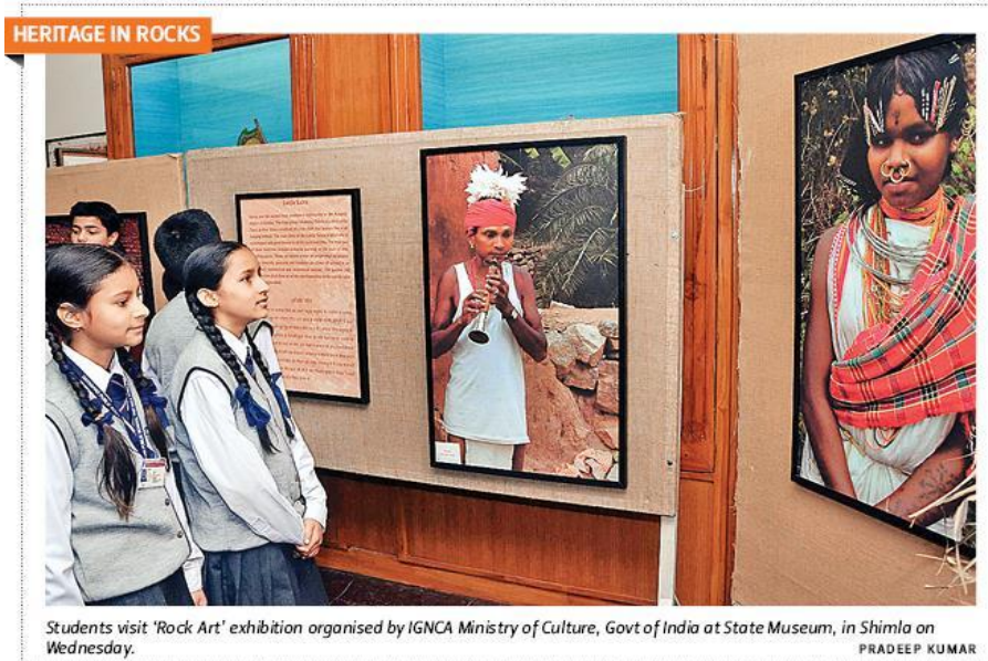
Students visit 'Rock Art' exhibition organised by IGNC Ministry of Culture, Govt of India at State Museum, in Shimla on Wednesday.