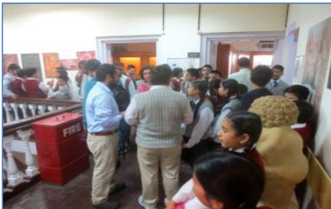
Visitors at the museum.