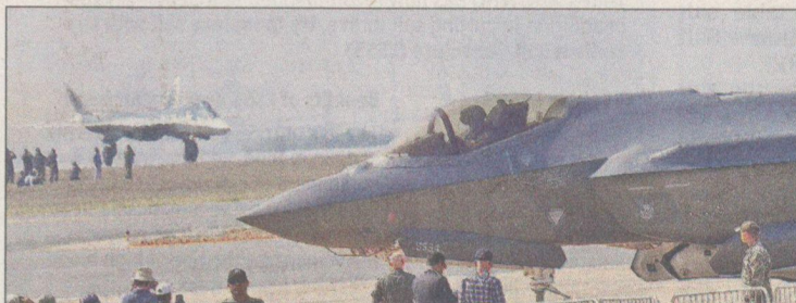
World's most advanced 5th-generation stealth fighter planes, Russia's Su-57 and America's F-35, parked at the same bay at Aero India show in Bengaluru on Monday