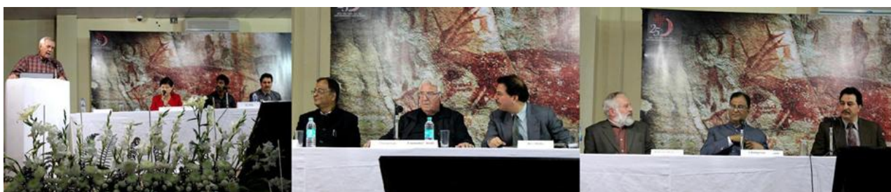
Fig. 2.- Distintas instantáneas de las Clases Magistrales impartidas durante la Conferencia Internacional de Arte Rupestre New Delhi '2012.

El evento se desarrolló durante 6 días en las acogedoras y bien confortables salas del IGNCA con sesiones matutinas y vespertinas las que concluían con “Clases Magistrales” dictadas por reconocidos especialistas de la talla de Emmanuel Anati, Robert G. Bernarik, Lawrence Loendorf, Roy Querejatzu y K. K. Chakravarty, los que brindaron una panorámica general de las investigaciones que se ejecutan en sus respectivos países y continentes, relacionadas con el dibujo rupestre.