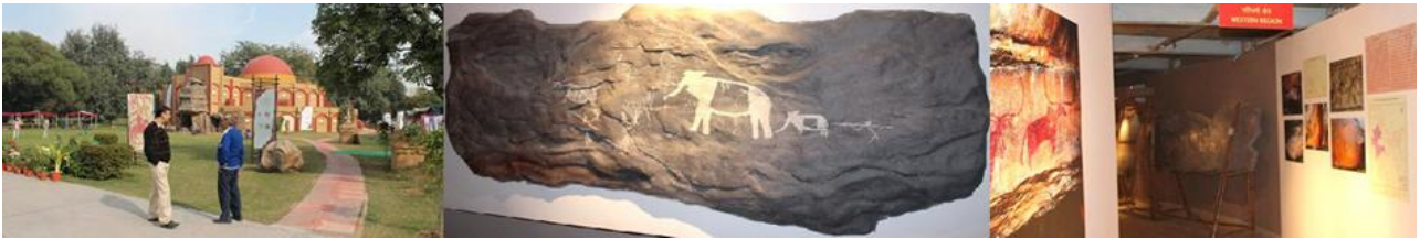
Fig. 4.- Vistas de la exhibición “Arte Rupestre de la India” organizada por el Indira Gandhi National Centre for the Arts y la Sociedad Arqueológica de la India. El pabellón; pictografía de Jaora, Madhya Pradesh; galería interior.

De extraordinario valor estético y didáctico para los visitantes, las escuelas y universidades que a diario acudían, resultó la exposición “Arte Rupestre en la India” organizada por el IGNCA y la Sociedad Arqueológica de la India (ISA). En ella el dibujo rupestre del vasto territorio del país oriental estaba representado por hermosas fotografías y excelentes reproducciones realizadas en maquetas de fibra de vidrio, que les permitían a los visitantes un recorrido de ensueño por las 6 regiones en que fuera dividida esta patrimonial manifestación.