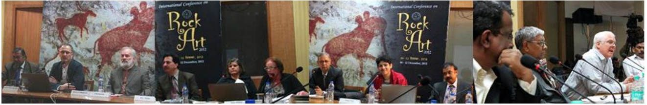
Fig. 6.- Imágenes de las presentaciones durante la Conferencia Internacional de Arte Rupestre New Delhi 2012.

En este sentido la publicación de las Memorias del encuentro y el libro de Resúmenes constituyen un invaluable material de consulta para expertos, profesionales, estudiosos y público en general, permitiéndoles una mirada que busca la reflexión y la toma de conciencia en la necesidad de proteger y divulgar este patrimonio, más allá de las publicaciones académicas. De la misma manera se dedicó especial interés a señalar la alta responsabilidad ética y moral de los investigadores del dibujo rupestre para con los pueblos originarios, muchos de los cuales conservan en la memoria y las tradiciones orales, este acervo cultural en grandes espacios geográficos de África, América, Asia y Australia.