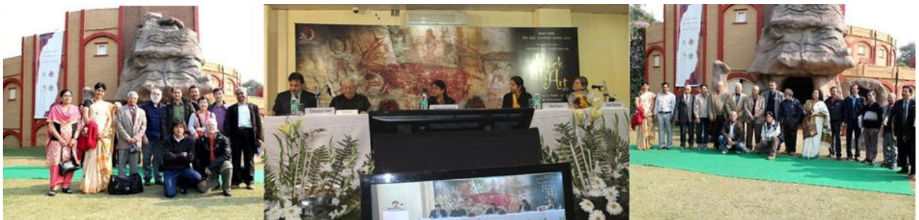
Fig. 7.- Actividad de clausura de la Conferencia Internacional de Arte Rupestre New Delhi 2012.